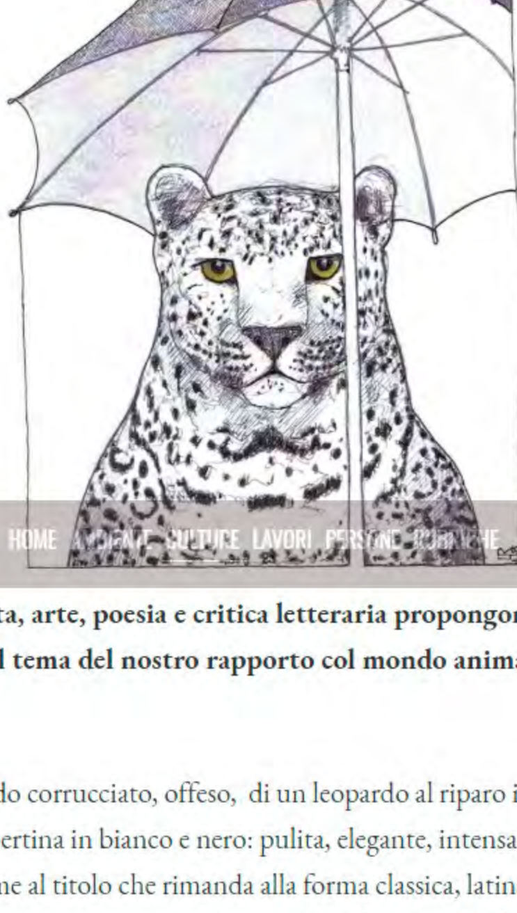
HEBHE SPUPICE LAVORI PERSONE RUBRICHE BLOG NETWORK VORREI CERCA NELL'ARCHIVIO

Nel libro di Elisabetta Motta, arte, poesia e critica letteraria propongono un percorso di riflessione sul tema del nostro rapporto col mondo animale.